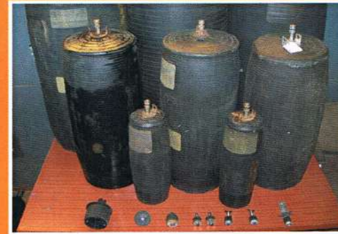
OBTURADORES DE TUBERÍAS